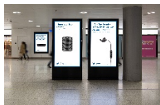
Bild: Digitec-Kampagne mit Kundenkommentaren im HB Zürich

https://www.digitec.ch/MWS/Release/180108_Medienmitteilung/Galaxus-Polit-Kampagne-HB-Zuerich.jpg