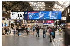
Bild: Galaxus-Polit-Kampagne im HB Zürich

https://www.digitec.ch/MWS/Release/180108_Medienmitteilung/Warenlager-Wohlen.jpg